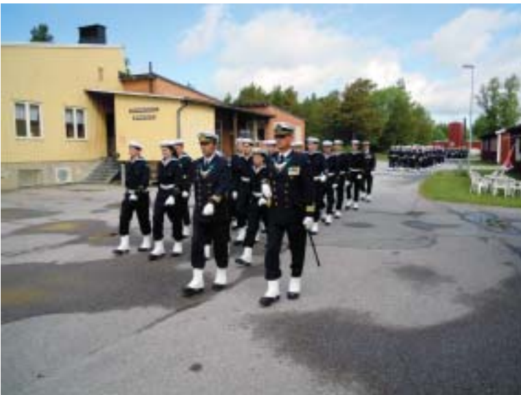
Generalrepetitionen avklarad och nu är Honnörskompaniet på marsch mot Stockholm.