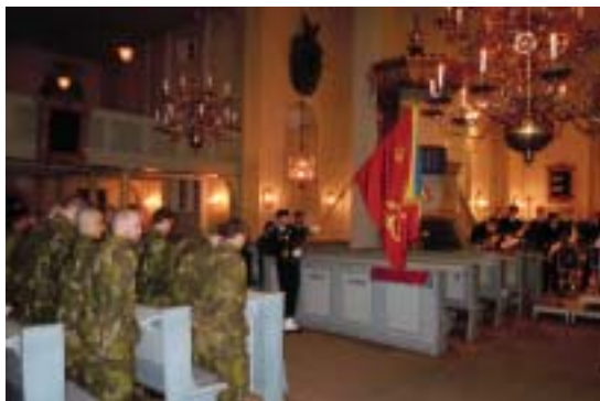
Denna bild illustrerar soldaterinran för Basskyddskompaniet den 9 mars 2010. Återigen är vår fana på plats i kyrkan.