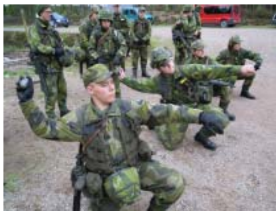
Under FSU-skedet (Fortsatt soldatutbildning) används Kosta övningsfält flitigt. Här övar sig sjömän i handgranatskastning i slutet av maj.