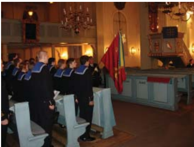
Soldaterinran för Sjömanskompaniet i Amiralitetskyrkan den 2 mars 2010. Regementsfanan på plats.