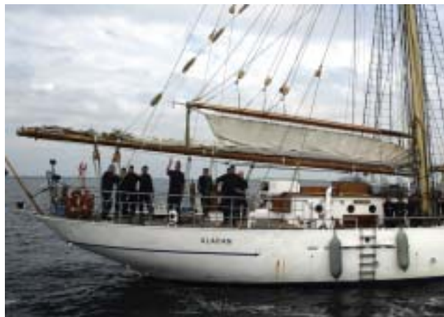
HMS Gladan åter i hemmafarsvatten efter en lång seglats.