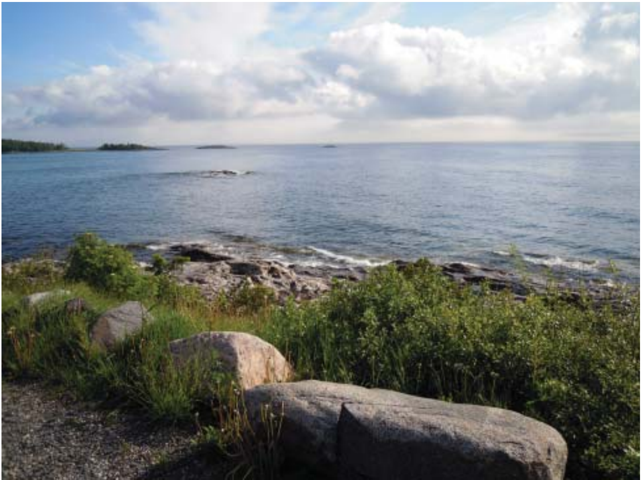
En vackrare övningsplats än Väddö skjutfält utanför Norrtälje är svårt att hitta.