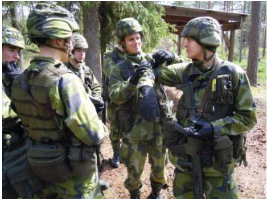
Stridsutrustade soldater förbereder sig inför nästa övningsmoment.