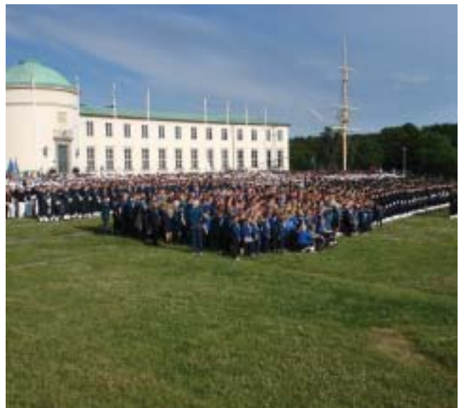
Samtliga deltagare som avmarscherade från Gärdet samlade framför Sjöhistoriska museet efter genomfört uppdrag