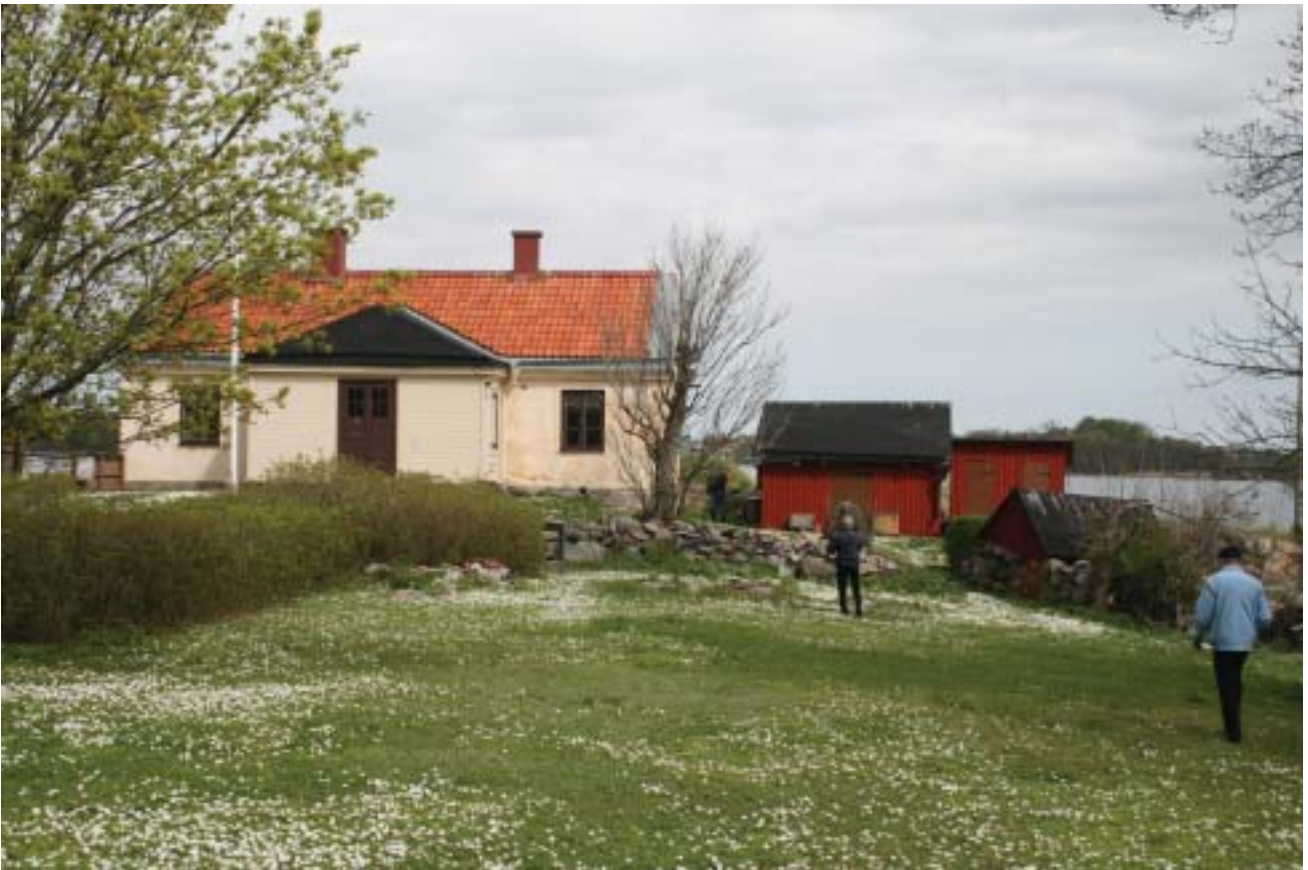
Koholmen i vårskrud