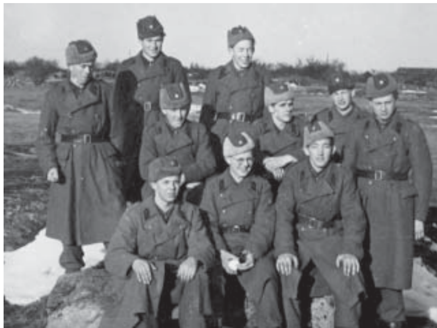
1945 års stamrekryter