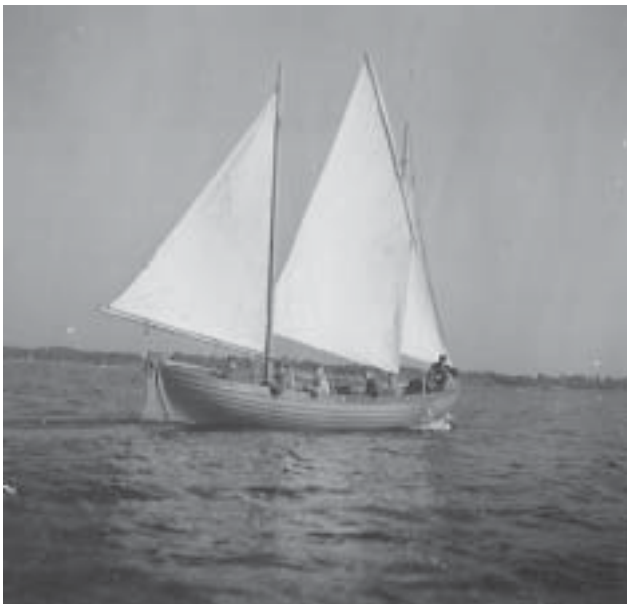
Segling med 10-huggarna