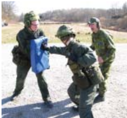
Närkampsutbildning av värnpliktiga från Sjömanskompaniet på Rosenholm i början av april.