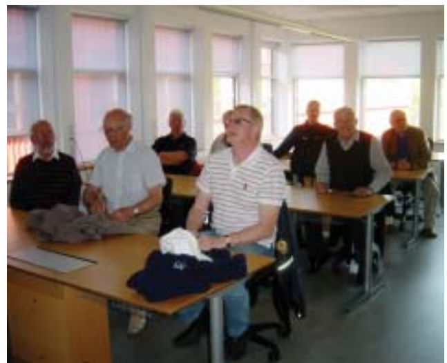
Här ser vi intresserade och flitiga elever ur årskurs " SENIOR "