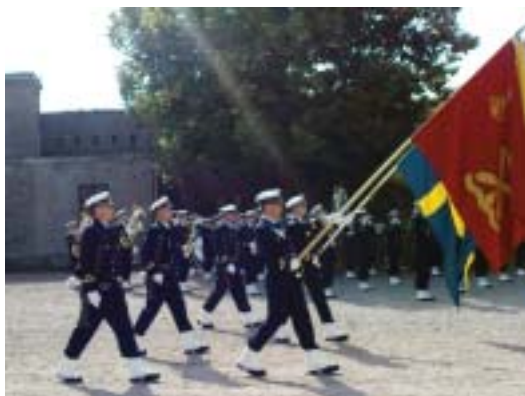
Den sammanslagna officersvakten marscherar in med Marinbasens tretungade flagga och KA 2 regementsfana.

Här nedan följer några bilder från de senaste ceremonierna: