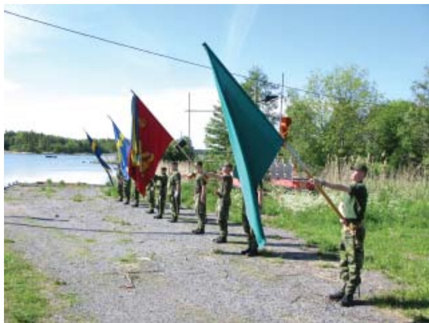
Regementsfanan under förövning på Vaddö skjutfält.