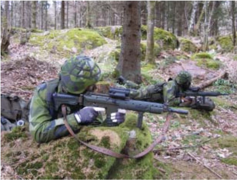
Soldatutbildning med AK 5C