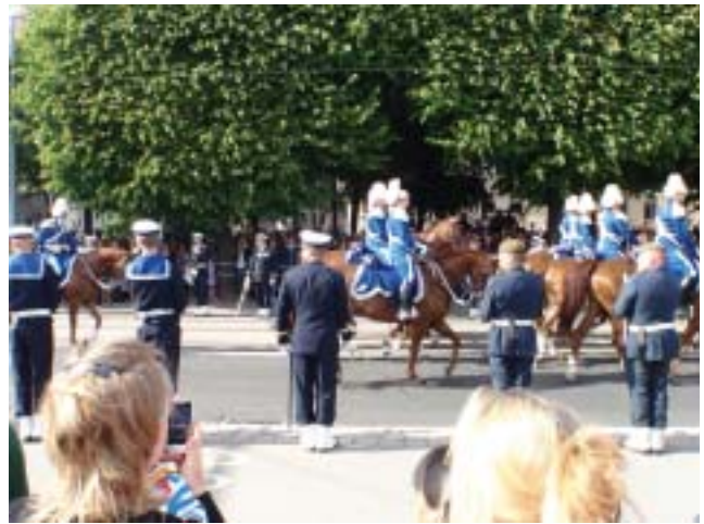
Kortegen passerar på Strandvägen.