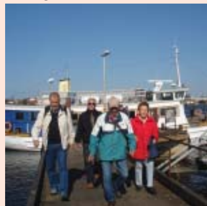
Bild från Vårutflykten, Deltagarna går iland på Basareholmen