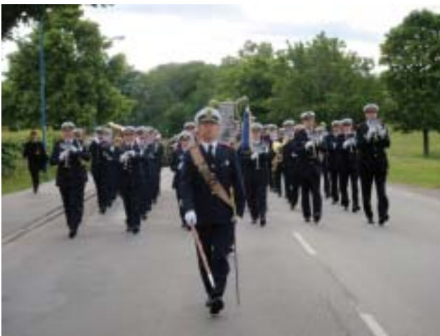
Göteborgs Hemvärnsmusikkår uniformerad med KA-uniform m/87 på återmarsch mot Gärdet