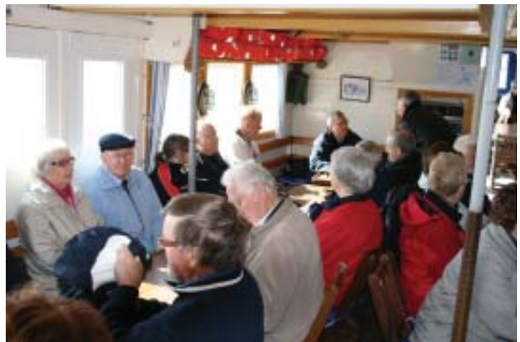
Ombord på Södern