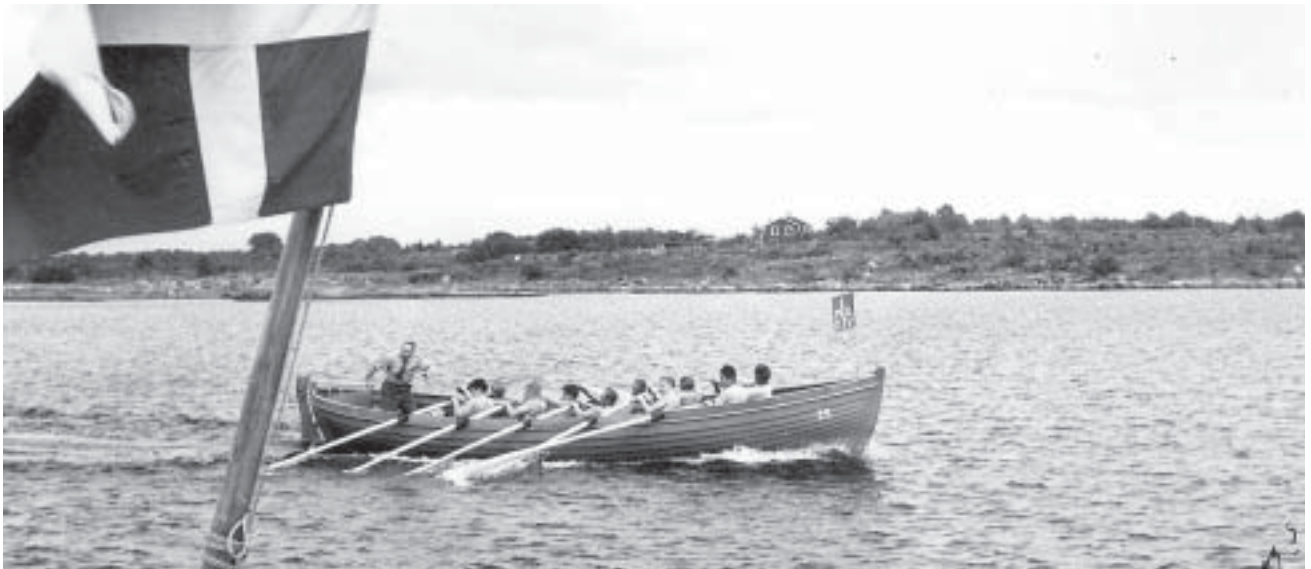
Kungsholmen-Tjurkö RegM 1956