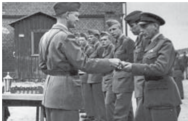
Prisutdelning vid KA 4 i Göteborg