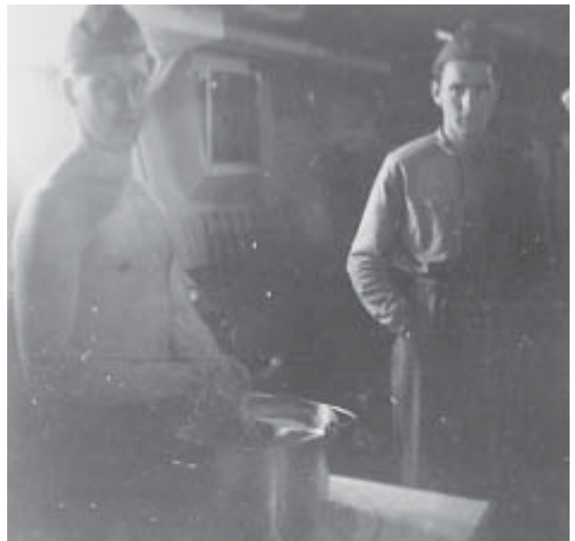
Utspisning MUL 13