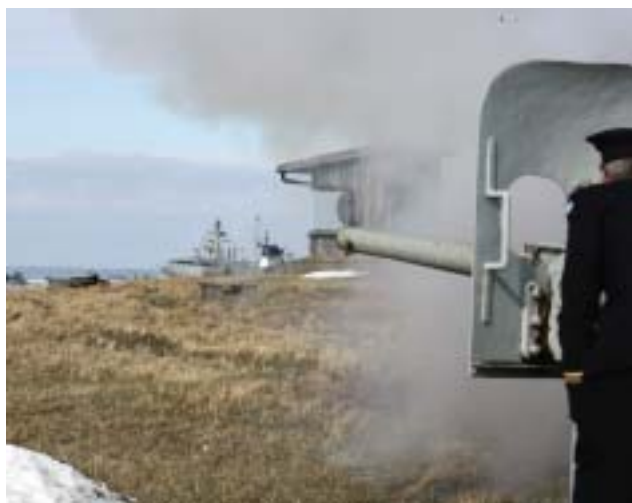
"Skjut två styck canonskått"

hissade fartyget röd signalflagga över blå och avgav salut med "ett styck canonskått". På detta svarade vi med att beordra svensk lösen med kommandot "skjut två styck canonskått" samtidigt som blå flagg hissades i signalmasten. När fartyget passerat halades den blå flaggan, och på ca 2 distansminuters avstånd halades även signalen "GMY" som vajad från masten på Donjonen.