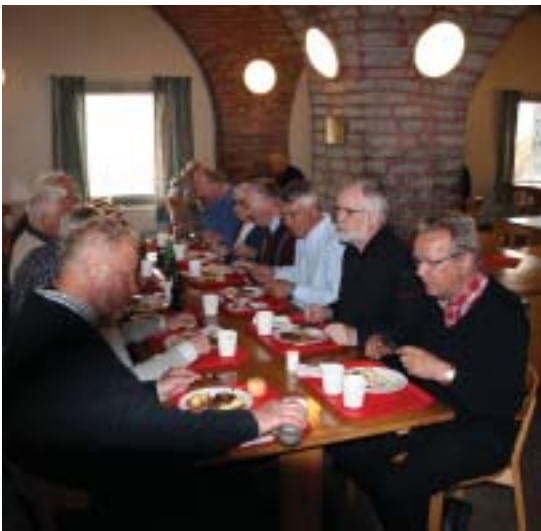
Lunch på Kungsholms fort.